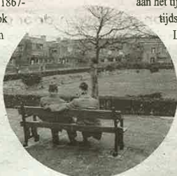
- De Papaverhof in 1955. -