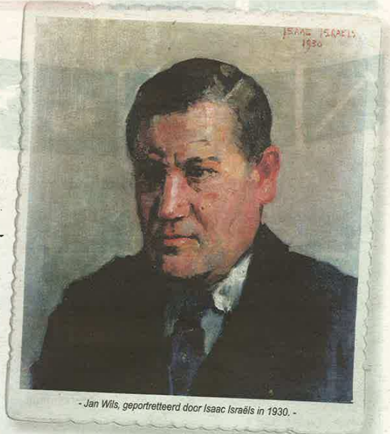
- Jan Wils, geportretteerd door Isaac Israëls in 1930. -

Wat Jan Wils binnen het socialisme en communisme niet gevonden had, vond hij wel bij de Vrijmetselarij. Van 1929 tot zijn dood is hij dan ook lid geweest van de loge L' Union Frédéric in Den Haag. Het ging dan vooral om begrippen als broederschap, geestelijke en morele verheffing, onderlinge waardering en wederzijdse hulp. Naast zijn beroep als architect heeft hij ook nog wel het een en ander gedaan. Hij schreef artikelen in Het Vaderland, hij was lid van het bestuur van de Haagse Kunstkring, van de Bond van Nederlandse Architecten en van het Algemeen Haags Comité. Dit comité organiseerde na de Tweede Wereldoorlog een groot aantal festiviteiten in onze stad. Van de kermis tot het bloemencorso, van het koninginnenconcert tot