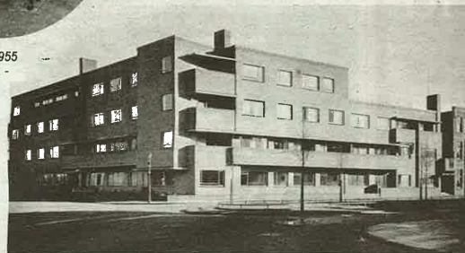
- Flatgebouw aan het Jozef Israëlsplein in Den Haag, gebouwd in 1925-1926. -